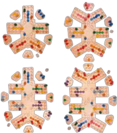
Abb.2: Weitere mögliche Spielfelder mit dem Erweiterungs-Set Fig. 2: Additional possible board layouts with the supplementary game set Fig. 2 : Autres champs possibles avec le jeu complémentaire